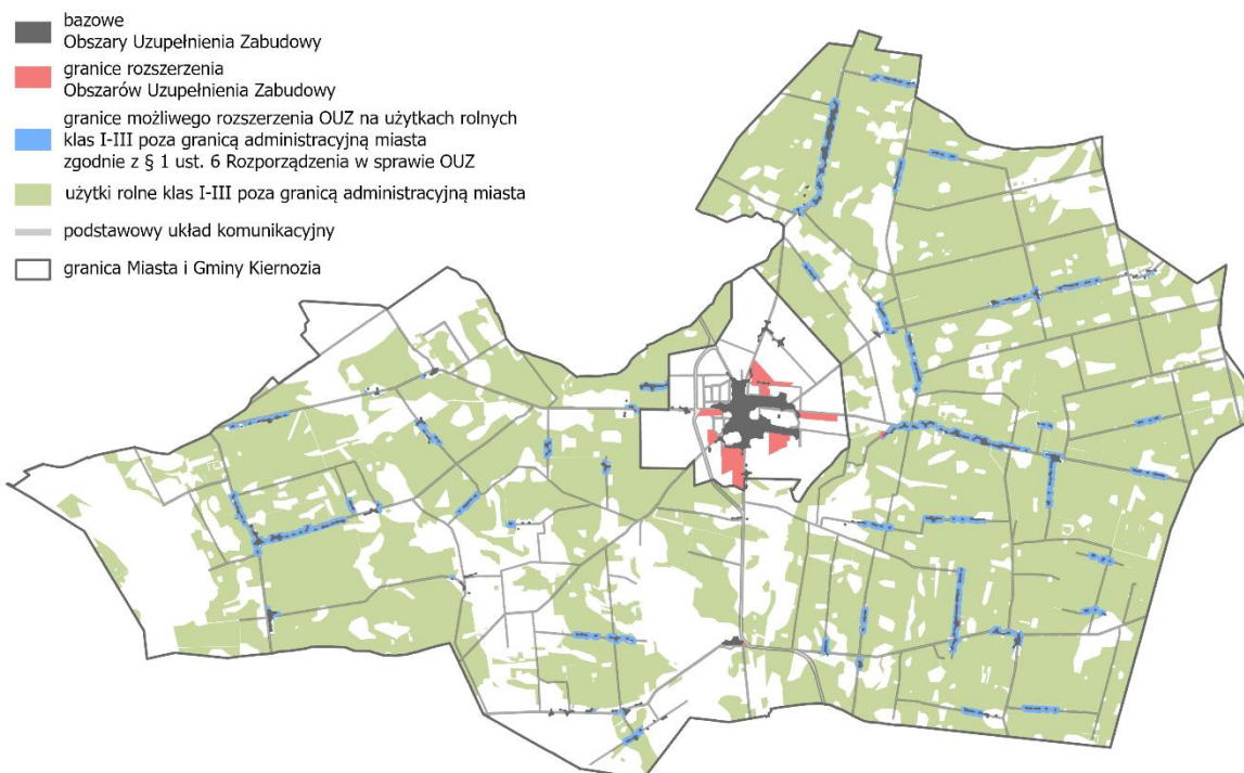
Rysunek 1. Obszary uzupełnienia zabudowy.